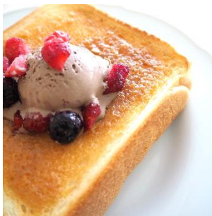
チョコアイスやフルーツと

シュガートーストシリーズはそのままはもちろん、アレンジを加えることで楽しみ方が広がります。2024年9月2日以降ホームページでレシピも公開します。ぜひ、楽しみにお待ちください。