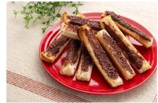
パンの耳でラスクにも

私たちソントングループは人と技術の力で世界の人々の健康と豊かな食文化の発展に貢献します。