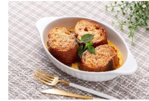
フレンチトーストにも