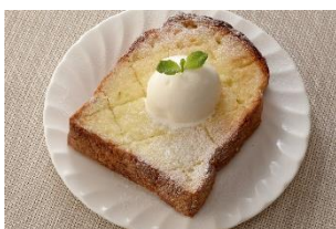
アイストッピング