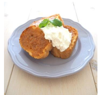
ホイップと合わせても◎